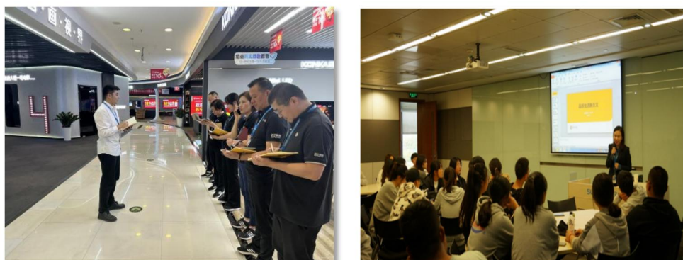
图1 学生就职于各行各业

实习及就业机会。毕业生可广泛就业于电子商务、数字广告、直播电商、智能制造、交通运输等多个行业，就业渠道宽，发展空间大。