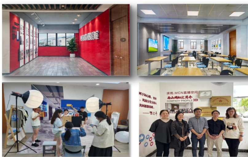
图2 校内外实训基地

同时，本专业与南京熊猫、苏宁易购等企业深度合作，将企业真实项目引入课堂，通过“学中做、做中学”的模式，使学生掌握智能工具应用、数据驱动决策和多岗位联动的实战能力，实现学业与就业的无缝衔接。